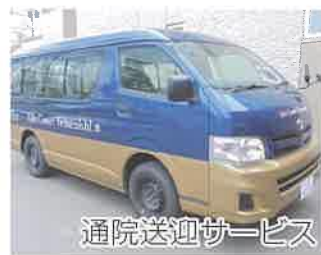
通院送迎サービス